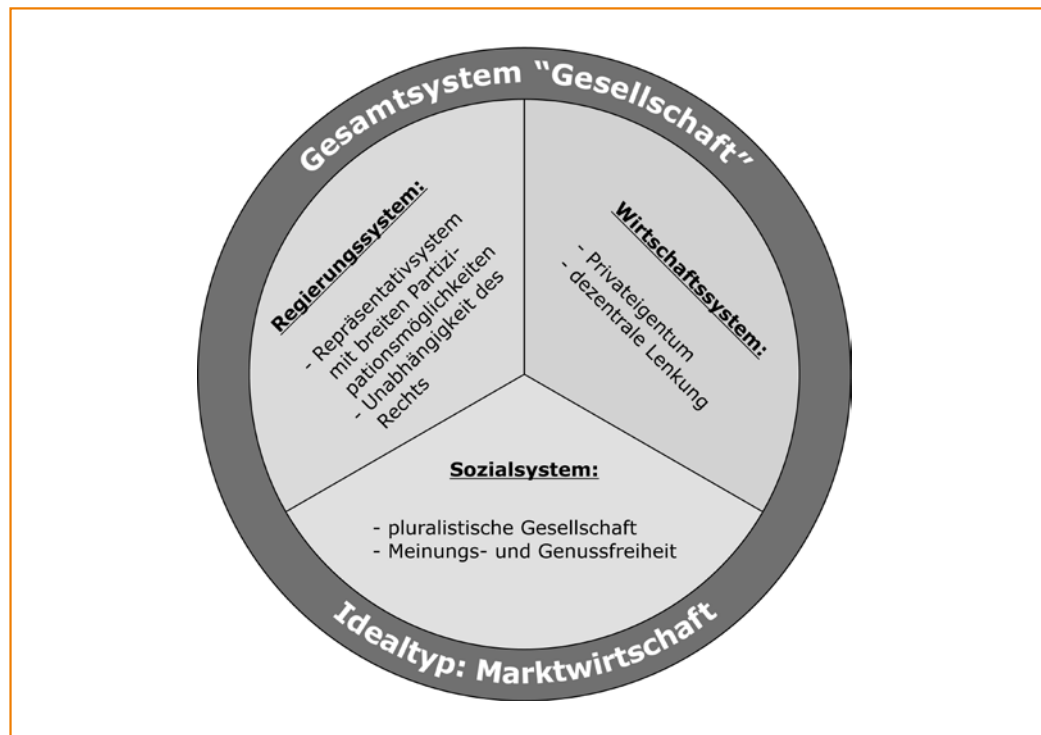
Abb. 2: Idealtyp „Marktwirtschaft“